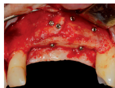
Cicatrisation osseuse quatre mois après la greffe