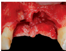
Défaut osseux avant la greffe